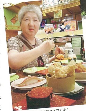
▲回転寿司 / 7月24日(水)