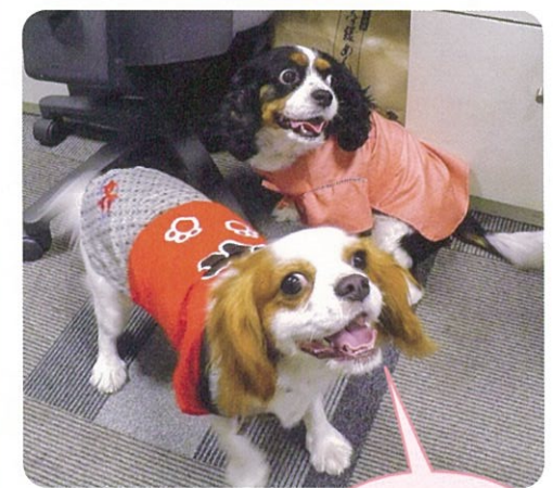
8月10日(土)の夏祭りにて。初代らんこのハッピーがキツキツのりりこ(手前)。成長盛りです