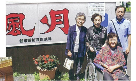
▲お好み焼き / 6月28日(金)

夏場の外出シーズンは、外食も楽しみのひとつです。あつあつのおいしさを堪能したお好み焼き、こぼれイクラに笑顔もこぼれた回転寿司、期せずして「男子会」となった焼肉など、今季もいろいろな料理に舌鼓を打ちました。外出できない方には、出前のお寿司で外食気分を味わっていただきました。