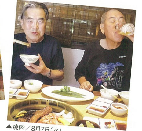
▲焼肉 / 8月7日(水)