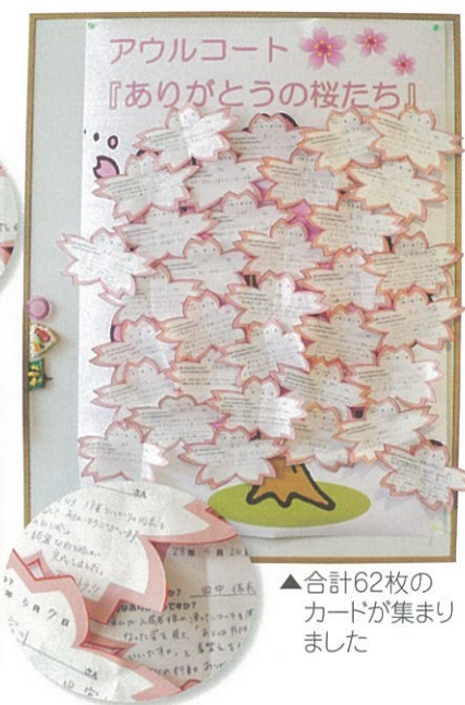
▲合計62枚のカードが集まりました

顔にするには、まず職員が笑顔になる環境であることが大切です。そこで、職員が試行錯誤し、互いに感謝を伝え合う「ありがとうカード」というものを考えました。日常業務で手助けなどを受けありがたいと感じた際、相手の名前付きでカードに感謝の言葉を書いて掲示する取り組みです。