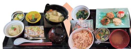
アウル膳 2025年 冬

月に一度のアウル膳はその象徴。普段とはちょっと趣を変えた家庭のごちそうが登場します。例えば、冬なら鍋物。夏なら冷たいお蕎麦と天ぷら。旬の食材