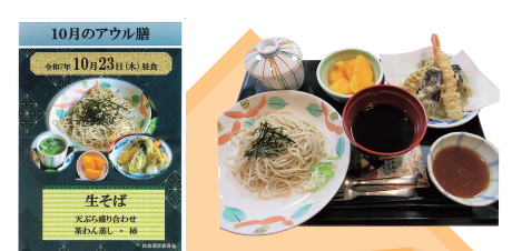
アウル膳 2025年 秋

を悩ませることが増えましたが、今後変化に富んだ食事が入居者様を笑顔にできるよう、厨房職員一同今年も頑張ります。