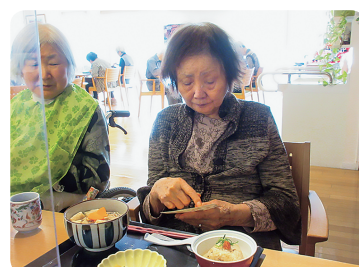
▲今月のお膳のお品書きを確認中