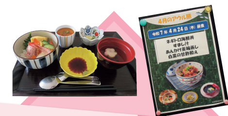
アウル膳 2025年 春