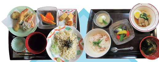
アウル膳 2025年 夏