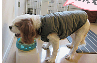
◀リレーエッセーにも登場し、感染症予防の啓発にも合いが入るりりこ